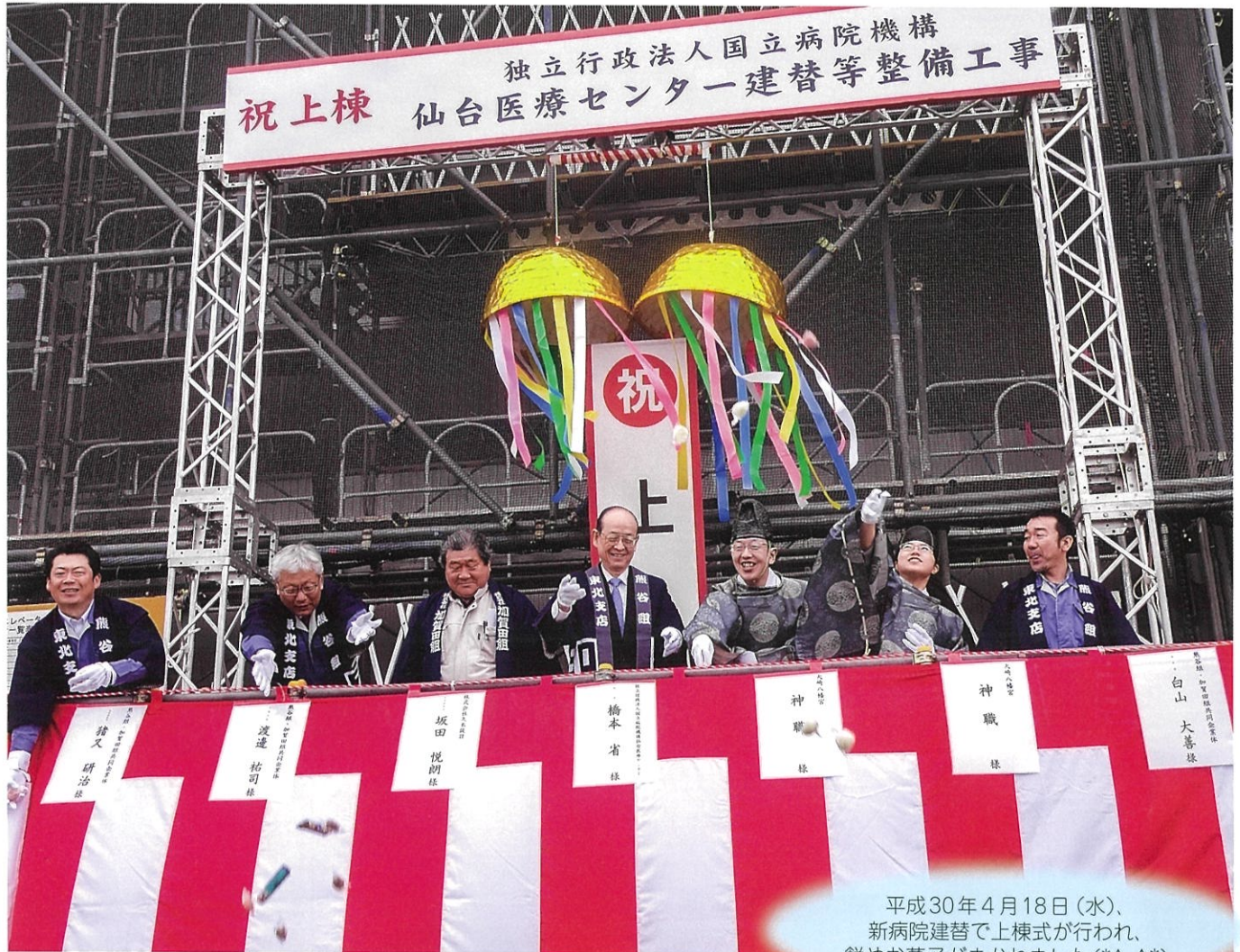
平成30年4月18日(水)、 新病院建替で上棟式が行われ、 餅やお菓子がまかれました(*^-^*)