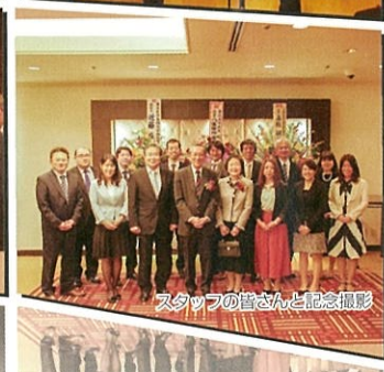
スタッフの皆さんと記念撮影