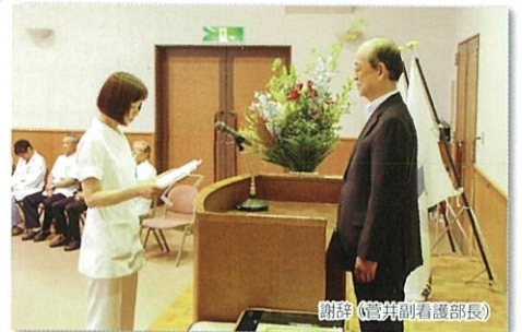
謝辞(菅井副看護部長)