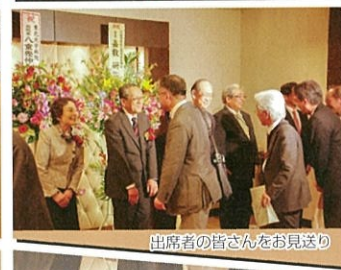
出席者の皆さんをお見送り