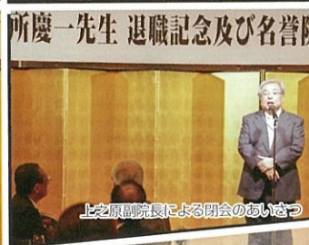
上之原副院長による閉会のあいさつ