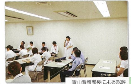
青山看護部長による総評