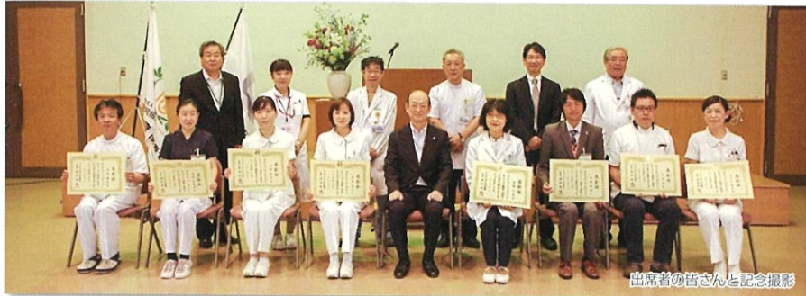
出席者の皆さんと記念撮影