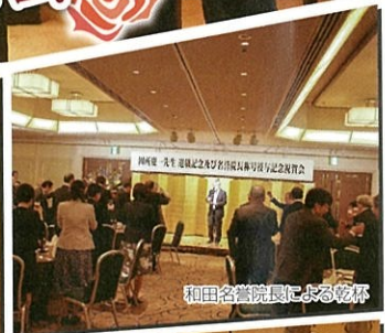
和田名誉院長による乾杯