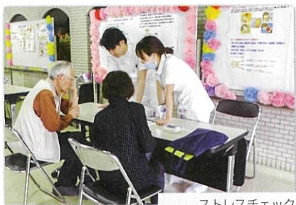
ストレスチェック