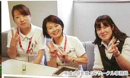
平成29年度QCサークル事務局