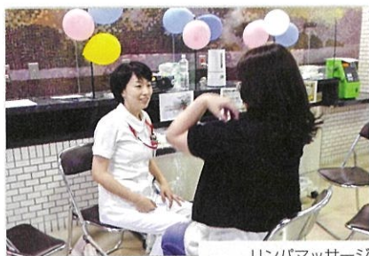
リンパマッサージ