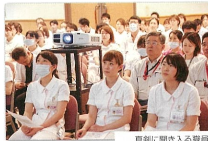
真剣に聞き入る職員