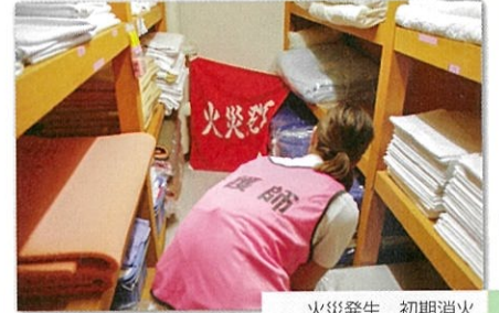
火災発生 初期消火