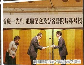
菊岡副院長から記念品を贈呈