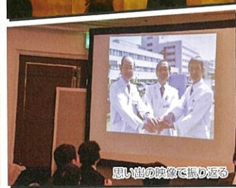
思い出の映像で振り返る