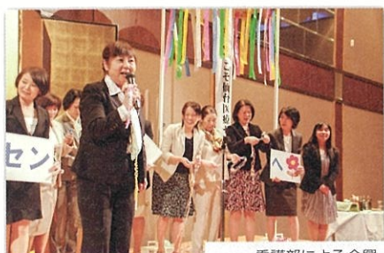
看護部による余興