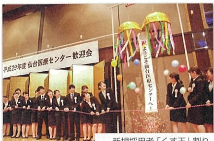
新規採用者「くす玉」割り