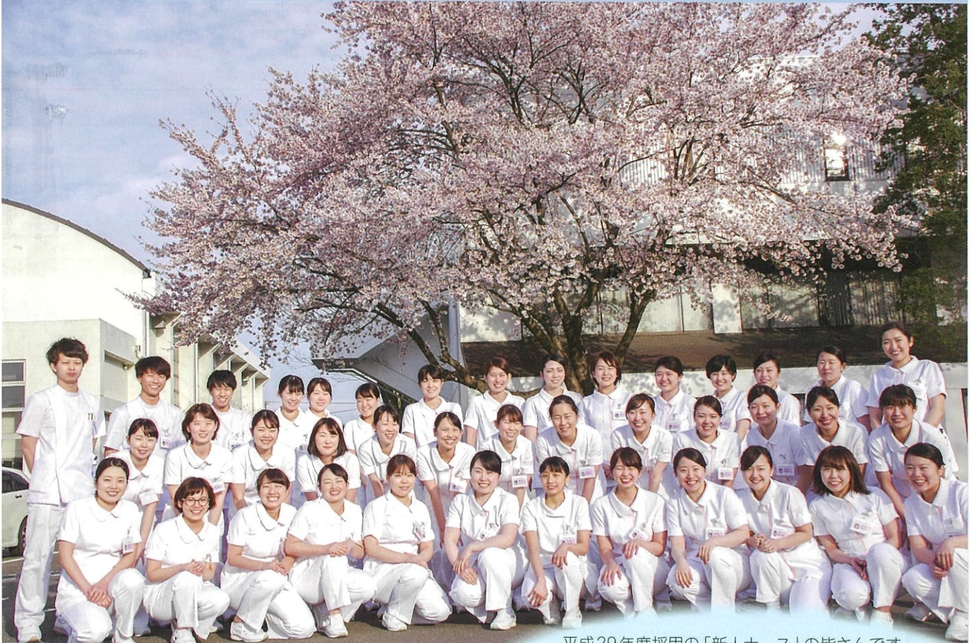
平成29年度採用の「新人ナース」の皆さんです。 この笑顔が当院の宝となり、 「患者さんにやさしい働きがいのある病院」に なることでしょう。