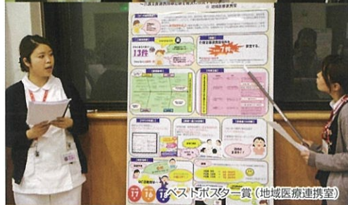
ベストポスター賞(地域医療連携室)