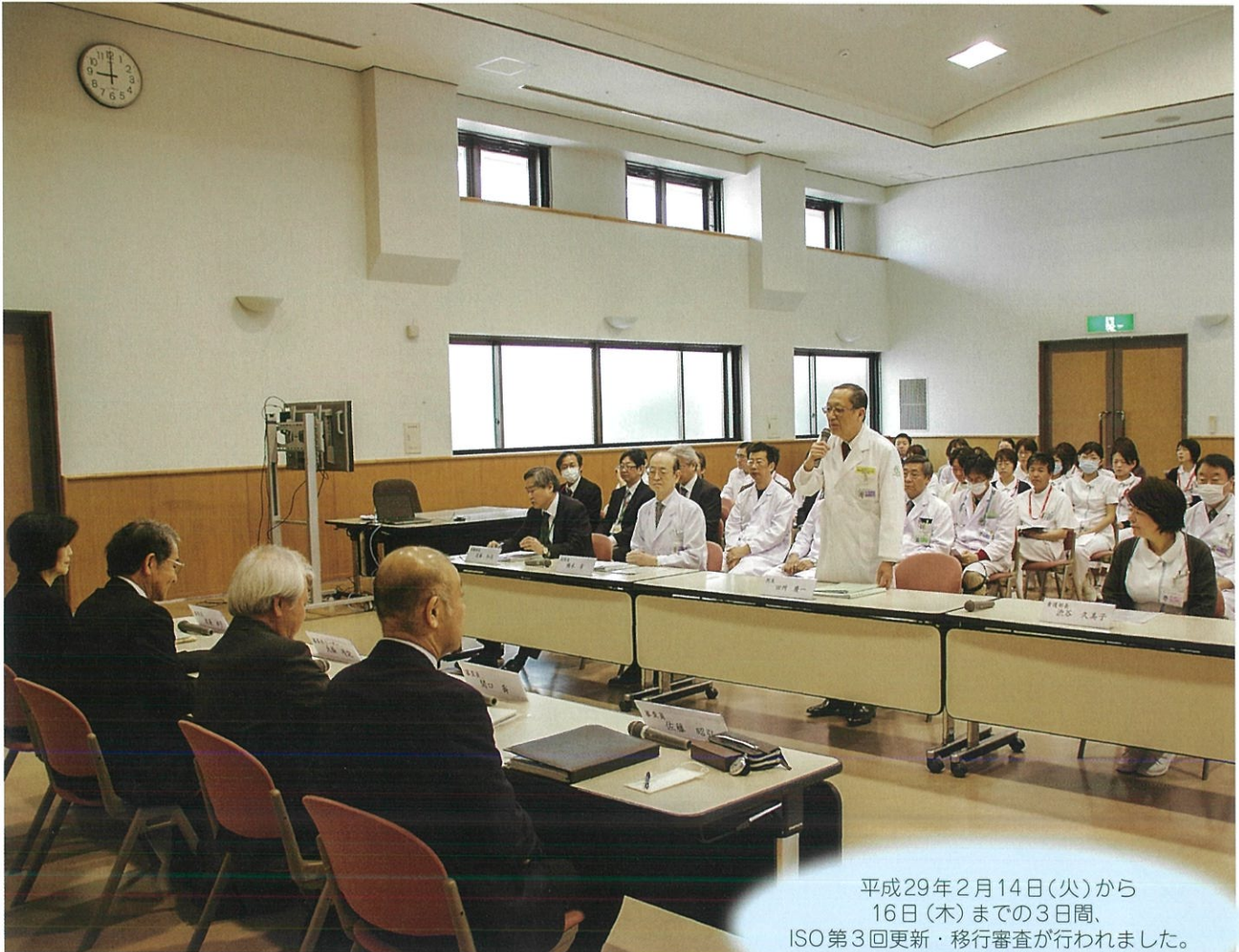
平成29年2月14日(火)から 16日(木)までの3日間、 ISO第3回更新・移行審査が行われました。 (関連記事P2)