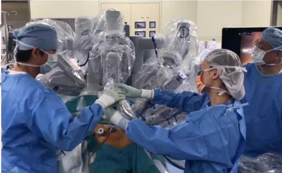
当院医師による「da Vinci胃がん手術」の様子